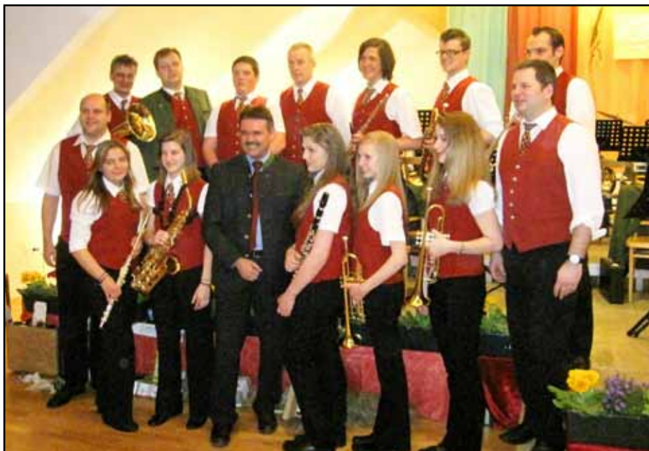
Die ausgezeichneten Jungmusiker und Solisten des Konzerts