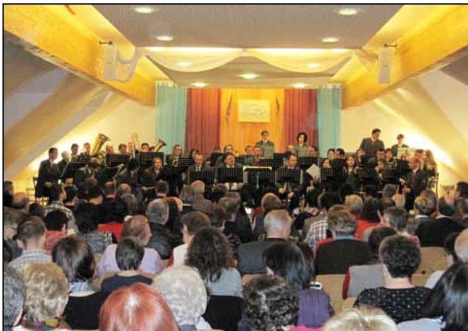
Der Dorfsaal Hanfthal war bis zum letzten Platz gefüllt - tolle Stimmung