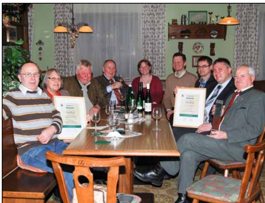
In heimischer Umgebung feierte die Hanfthaler Delegation die Auszeichnung

In der Auseinandersetzung mit dem Hanf in seinen vielfältigen Nutzungsmöglichkeiten hat die Dorfgemeinschaft Hanfthal verstanden, einen neuen touristischen und wirtschaftlichen Schwung in die Gemeinde zu bringen. Die vielfältigen Kooperationen über die eigenen Grenzen hinaus sind Zeichen von Weitblick und der Bereitschaft, neues nicht nur selber entwickeln zu wollen, sondern Erfahrungen sowohl weiterzugeben als auch anzunehmen.