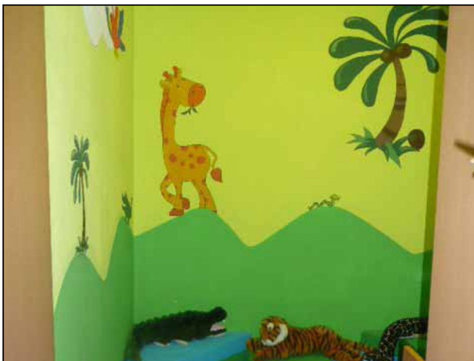
Künstlerische Gestaltung von den Eltern für die Kindergartenkinder

Den Kindergartenkindern gefällt die neu gestaltete Lesecke so gut, dass sie gar nicht mehr heraus wollen. Somit eine rundum gelungene Initiative.