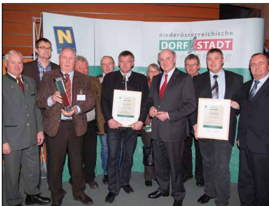
Landeshauptmann Dr. Erwin Pröll gratuliert Hanfthal zum Sieg

Zusätzlich wurde der aktive Dorferneuerungsverein in der Kategorie Ganzheitlichkeit als Finalist ermittelt. Die Siebergemeinde Allhartsberg vertritt Niederösterreich beim Europäischen Dorferneuerungspreis 2012. Nachdem der Ort in den Vorjahren bereits als Sieger 2003 in der Kategorie „Neue Medien“ mit der Homepage und dem Mitteilungsblatt sowie 2009 mit dem „Multifunktionellen Kellerensemble“ ermittelt wurde, fand die Vereinsarbeit eine weitere öffentliche Würdigung durch Landeshauptmann Dr. Erwin Pröll. 99 Projekte wurden eingereicht, über 300 Besucher nahmen an der Preisverleihung im NÖ Landhaus teil.