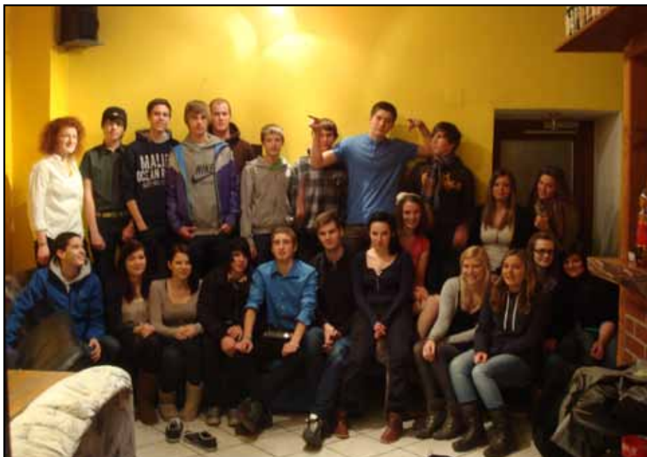
Die große Schar der Jugendlichen im Hanfthaler Jugendheim

Eine weitere zukünftige Aktivität wird die Erneuerung des Rasens in unserem Garten, sowie die Neugestaltung unserer Laube sein.