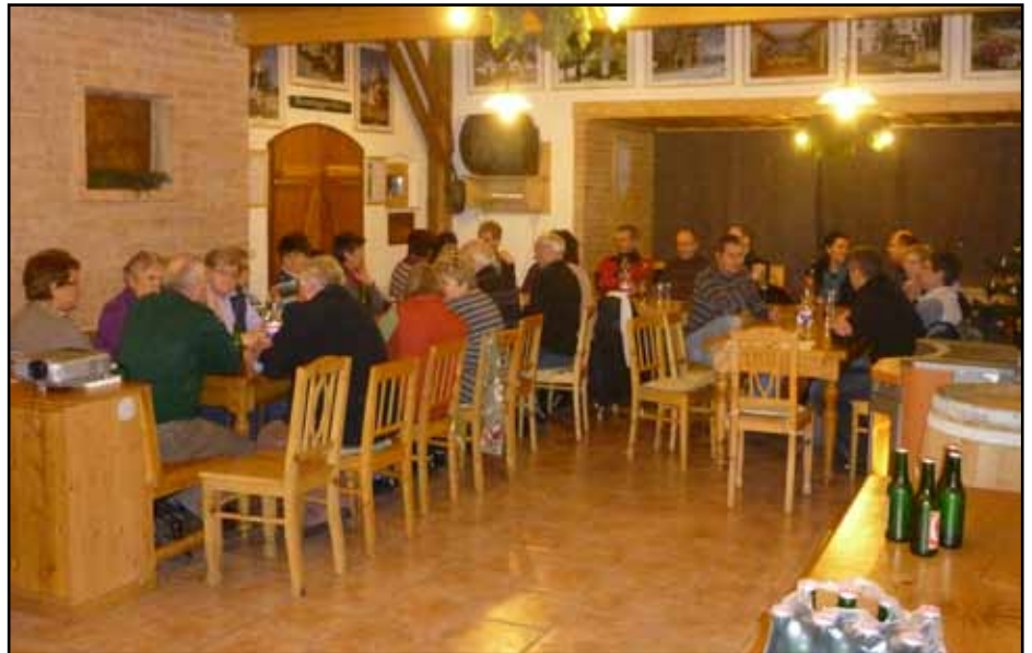
Volles Haus bei der Nachbesprechung zum Advent am Beri

Die Dorfgemeinschaft Hanfthal bedankt sich besonders bei der KFB für die großzügige Spende vom Erlös im Kaffeehaus.