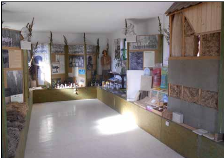
Das neu gestaltete Hanfmuseum