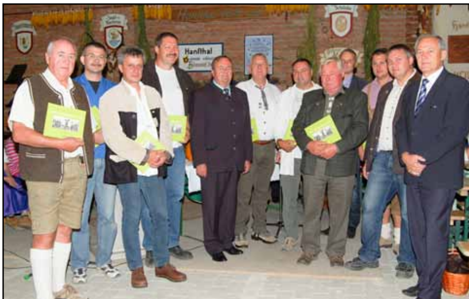
Die eifrigsten Helfer erhielten ein Erinnerungsgeschenk

An dieser Stelle nochmals ein herzliches Dankeschön an alle freiwilligen Helfer, welche durch ihren Einsatz die Sanierung und Errichtung des Dorfstadls ermöglichen haben.