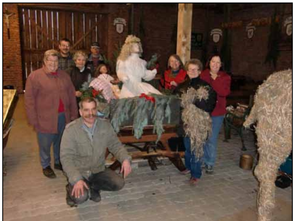
Eifrige Helfer bei den Vorbereitungsarbeiten für den Advent am Beri 2011