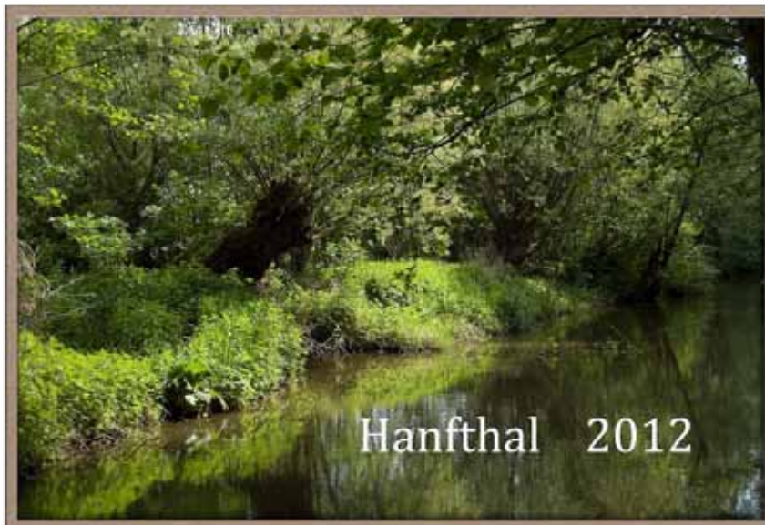
Das Titelblatt des diesjährigen Hanfthaler Dorfkalenders

An dieser Stelle dürfen wir uns bei "unserem" Fotografen Ferry Braun für die Erstellung der Dorfkalender, sowie für die Fotodokumentationen unserer Feste und Veranstaltungen recht herzlich bedanken. Das ist aktive Mitarbeit in der Dorferneuerung.