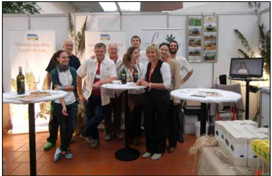
Hanfmesse Cultiva - Stand von Hanfthal und Hanfstrohverwertungs GmbH

In der Beilage finden Sie die Broschüre „HANF“ und unseren touristischen Hanferlebnis-Folder mit einem Lageplan, Sehenswürdigkeiten und Stationen des Hanferlebnispfades.