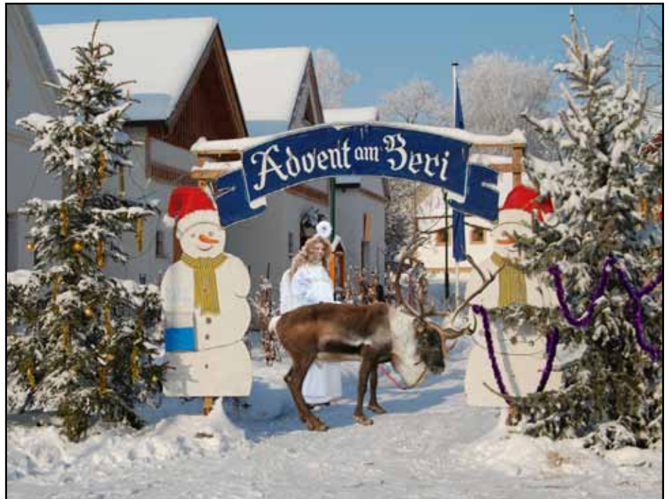
Erstmals in Hanfthal - das Rentier Rudolph mit einem Engelchen

Die Vorbereitungsarbeiten laufen bereits seit den letzten Wochen auf Hochtouren. Jede zusätzliche helfende Hand ist gerne gesehen. Wir sind sicher, auch heuer wieder ein einzigartiges Fest zu erleben.