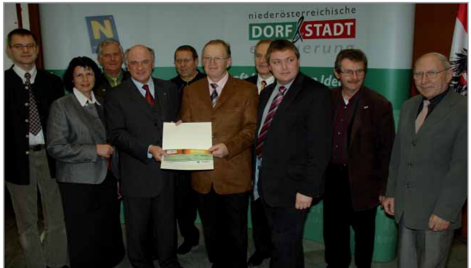
Die Delegation aus Hanfthal bei der Siegerehrung in St. Pölten