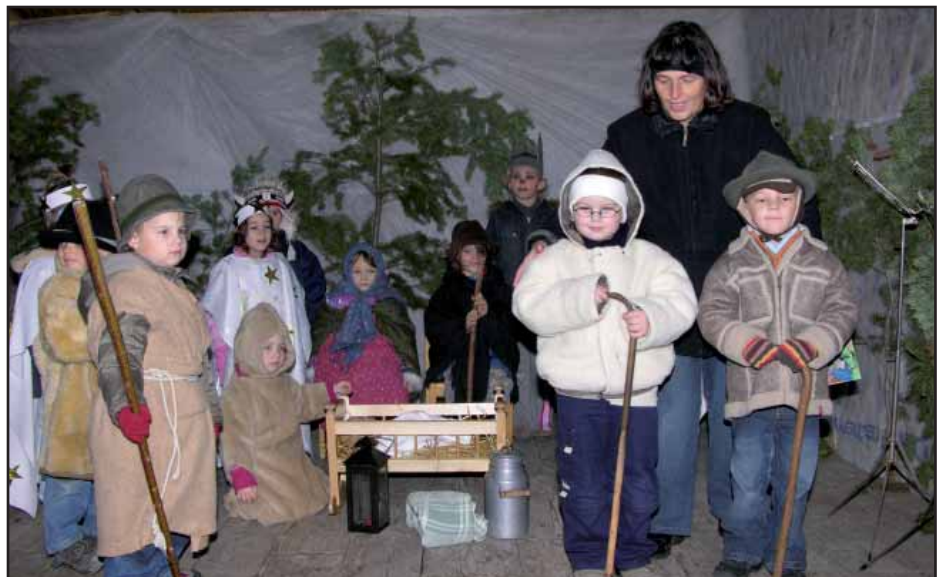
Der Kindergarten unterhielt das Publikum mit einer Weihnachtsgeschichte