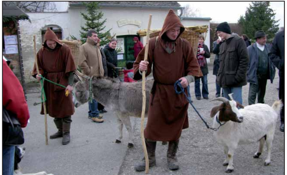
Bereits Tradition beim Advent am Beri - unsere Hirten mit dem lieben Vieh

Das Angebot mit selbstgebasteltem Weihnachtsschmuck und den nicht alltäglichen Köstlichkeiten wie selbstgemachte Weihnachtsbäckerei und Schokolade, Weinguglhupf, Bratäpfeln, geräucherte Forellen, Sauschädl uvm. versetzt die Besucher in vorweihnachtliche Stimmung. Nachdem beinahe alle örtlichen Vereine Nutznießer dieser Veranstaltung sind, sollte künftig die Dorfgemeinschaft arbeitsmäßig entlastet werden. Jedenfalls haben wir uns mit dieser Veranstaltung einen Ruf weit über unsere Bezirksgrenzen geschaffen. Wohl zu Recht wird der Advent am Beri von den Besuchern als einer der schönsten Adventmärkte im Land bezeichnet.