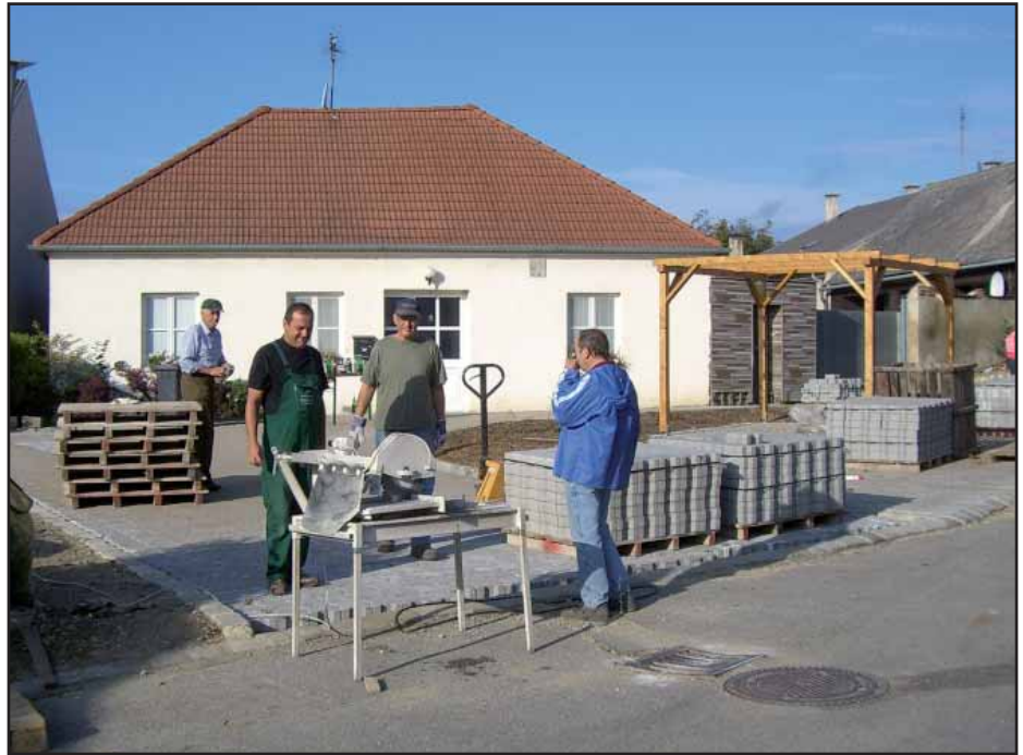
Das Kölla-Platzl mit Laube am Beri kurz vor der Fertigstellung

Das Thema Hanf ist inzwischen zum Markenzeichen unseres Dorfes