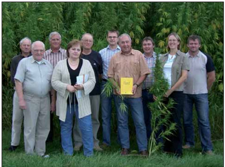
Für den kommenden Tourismus bestens ausgebildet: Die Hanferlebnisleiter

geworden. Unsere innovativen Bauern gründeten eine Hanfstrohverwertungs-Gesellschaft und zählen zu den Hanf-Pionieren in Österreich. Mit der Ausbildung von Hanf-Erlebnisleitern konnte unser Ort auch touristisch positioniert werden und ist Fixpunkt im neuen Tourismuskatalog im Land um Laa. Mit dem Hanf- und Erntedankfest wurde gute Öffentlichkeitsarbeit geleistet.