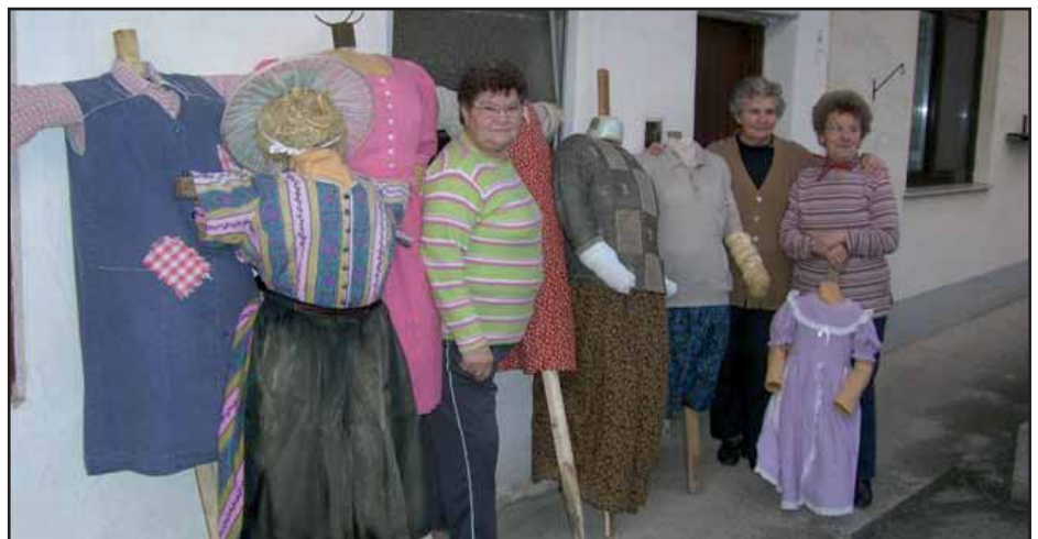
Schon jetzt laufen die Vorbereitungsarbeiten für das Bluzafest 2007 an