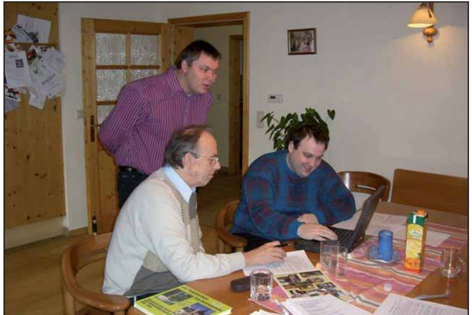
Start zur Überarbeitung unserer Homepage: www.hanfthal.at

Es wird künftig einen eigenen Button für die Dorferneuerung und für Tourismus geben. Ein umfangreiches Bildarchiv mit Dorfansichten, Fotos von Projekten und Festen sowie Blumenschmuck soll dem Besucher einen Eindruck über unseren Ort geben. Erfreulicherweise hat die Stadtgemeinde die Domainkosten für unseren Internetauftritt übernommen, dafür ein herzliches Dankeschön. Ab sofort kann man von unserer Startseite auf die wöchentlichen Berichte von